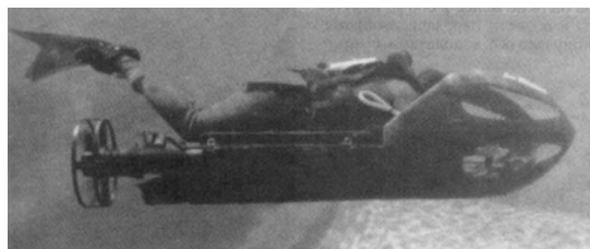
Նկ. 4. Ամերիկյան PDP ստորջրյա քարշակ

Փոխադրամիջոցներ: Մեծ հեռավորությունների վրա հակառակորդի մերձափնյա տարածքում նախապատրաստական աշխատանքներ կատարելու համար մարտական